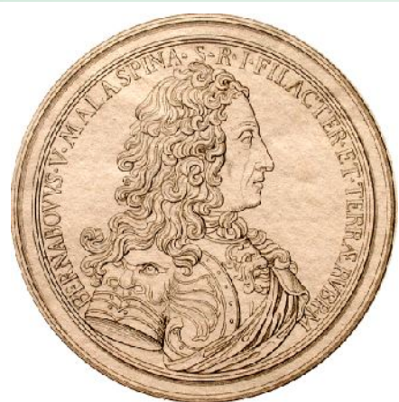
Medaglia con ritratto di Manfredo Malaspina, marchese di Filattiera e Terrarossa

piani superiori trovarono rifugio famiglie di modeste fortune.